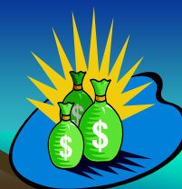
Figuras 1 y 2