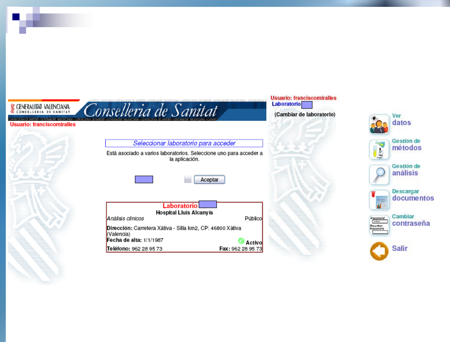
Figura 1. Acceso a los participantes en el PEECLCCV

en un entorno de desarrollo Visual Studio 2005 con Arquitectura: ASP.NET sobre C#, con dos niveles de acceso: uno para los participantes (Figura 1) en el PEECLCCV, que les autoriza a consultar sus datos, revisar su metodología, introducir resultados (Figura 2), descargar informes actuales e históricos y cambiar su contraseña. El otro nivel, para la Secretaría del PEECLCCV, que permite realizar todos los procesos de gestión a través de la red.